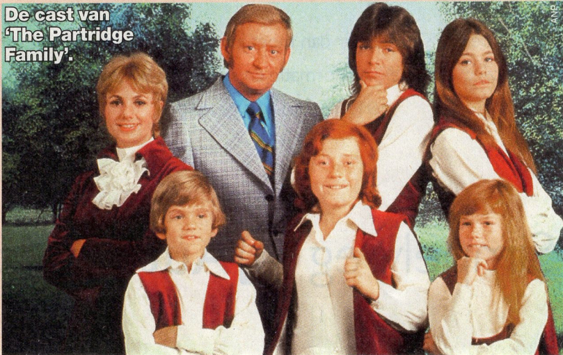
De cast van 'The Partridge Family'